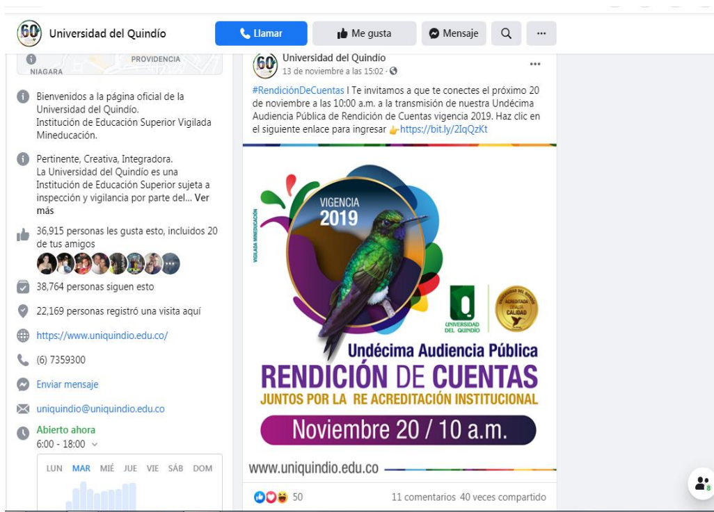
Foto 3. Divulgación a través de Facebook de la rendición Pública de cuentas – Vigencia 2019

En la rendición pública de cuentas el Rector de la institución presentó los indicadores que dan cuenta de los avances en el Plan de Desarrollo Institucional durante la vigencia 2019 y resaltó proyectos importantes de inversión para la Universidad que se llevarán a cabo en las próximas vigencias.